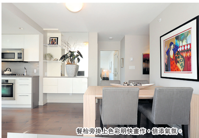
餐枱旁掛上色彩明快畫作，倍添氣氛。