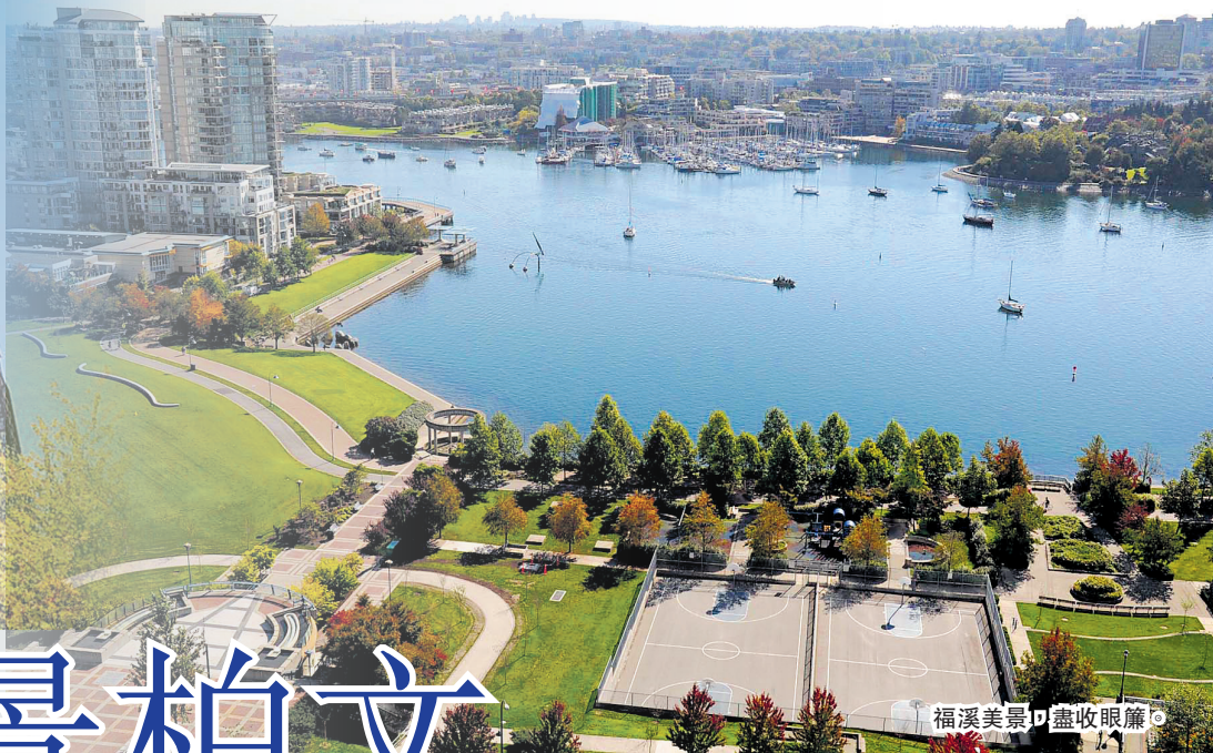
福溪美景盡收眼簾。

上述物業資料由BestHomesBC.com的Nicola Way及AssignmentsCanada.ca提供。欲查詢任何地產資料，請電郵至nicola@besthomesbc.com。