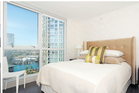
睡床擺在大窗旁，躺在床上也能欣賞窗外美景。