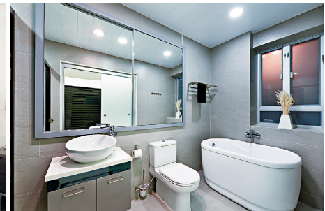
沐浴間與廁所設計簡潔新穎。