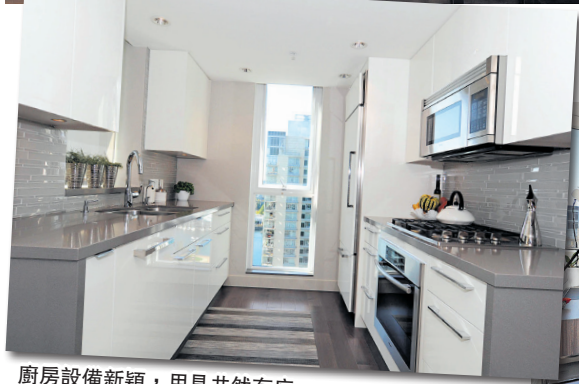
廚房設備新穎，用具井然有序。