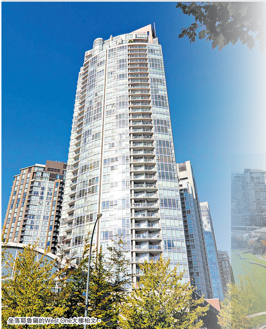
坐落耶魯鎮的West One大樓柏文。

這個東南角柏文單位坐落耶魯鎮，屬於West One大樓，建於2002年，但在7年前花了超過10萬元重新設計和提升質素。單位內每個房間都能欣賞到福溪的美景，還有室內優雅而專業的設計，不但鋪有硬木地板，而且安裝了從地板至天花板的窗戶和玻璃門，還有鋪了瓷磚的浴室、訂制櫃子及地熱等。廚房則安裝了高光澤白色廚櫃、名牌Miele和Sub-Zero家電和玻璃擋板。