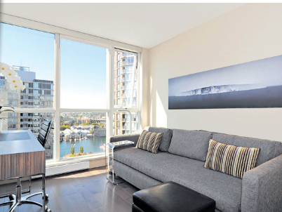
書枱後擺放了沙發，工作倦了即可休息一下。